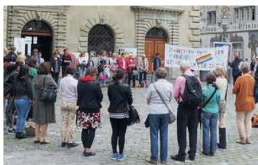
Stiller Ausdruck der Solidarität mit Menschen in Not.

Seit vielen Jahren bringt eine breit abgestützte Trägerschaft von 16 Organisationen mit dem «Schweigen für den Frieden» auf leise, aber kraftvolle Art zum Ausdruck, dass oft die Worte fehlen, um auf das Elend von Flüchtlingen, von Krieg, Hunger und Unterdrückung weltweit zu reagieren. «Mit dem Schweigekreis setzen wir ein Zeichen der Anteilnahme und Verbundenheit gegen die Gleichgültigkeit», heisst es in der Ausschreibung für das Jahr 2022. Menschen mit prekärem Aufenthalt wie Asylsuchenden und Sans-Papiers gelte die Solidarität. Die stille halbe Stunde findet auf dem Kornmarkt (Rathausplatz) in Luzern statt; jeweils donnerstags von 18.30 bis 19 Uhr. Termine 2022: 27.1., 17.2., 31.3., 28.4., 19.5. (ausnahmsweise Hirschenplatz), 30.6., 25.8., 29.9., 27.10., 24.11., 1.12., 8.12., 15.12., 22.12.