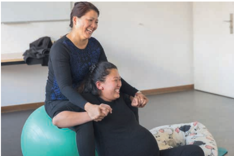
In einem der «Mamamundo»-Geburtsvorbereitungskurse, die von Caritas Luzern geleitet werden.

Das Thema des diesjährigen Caritas-Sonntags lautet deshalb: «Frauen sind stärker von Armut betroffen als Männer». Die Kollekte aus den Gottes-