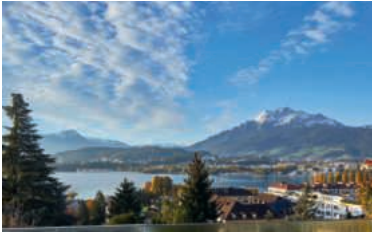
Blick vom Restaurant «Annamia» auf Pilatus und See.