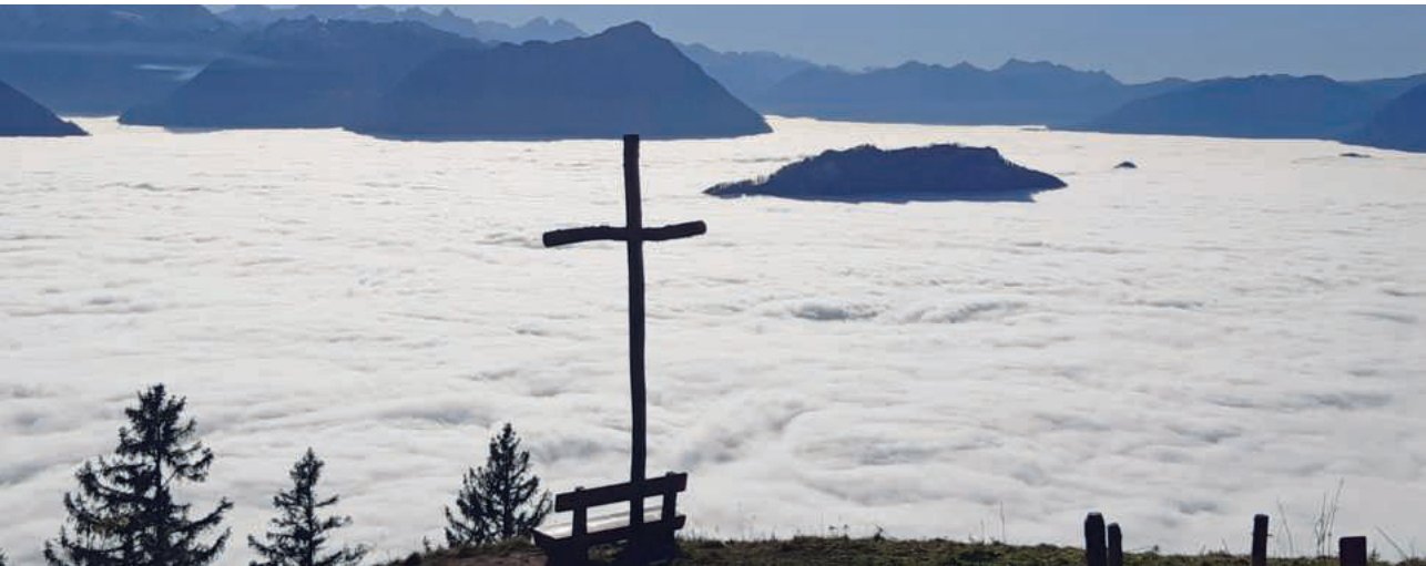
Blick von der Rigi auf das Nebelmeer über dem Vierwaldstättersee

..... D ie Sonne scheint jeden Tag. Wir müssen nur lernen, sie auch hinter dicken Wolken zu erkennen.