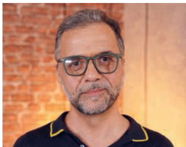
Meinrad Furrer sieht heutige religiöse Menschen als Pilgernde.