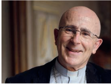
Der Churer Bischof Joseph Bonnemain feiert Gottesdienst in der Jesuitenkirche Luzern.