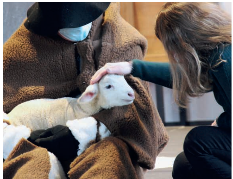
Ein echtes Lämmchen war in der Wikonener Kirche der Hingucker im Weihnachtsgottesdienst.

Alle möchten alt werden, aber niemand möchte alt sein. Warum eigentlich? Das Alter ist Erntezeit und kann eine Chance sein.