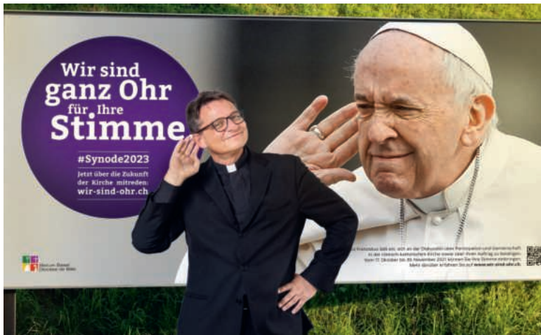
Papst und Bischof wollen ganz Ohr sein, doch die Gläubigen des Bistums Basel fühlen sich von ihnen nicht wirklich gehört, wie die Umfrage zeigt.

Schlussbericht: wir-sind-ohr.ch/ergebnis