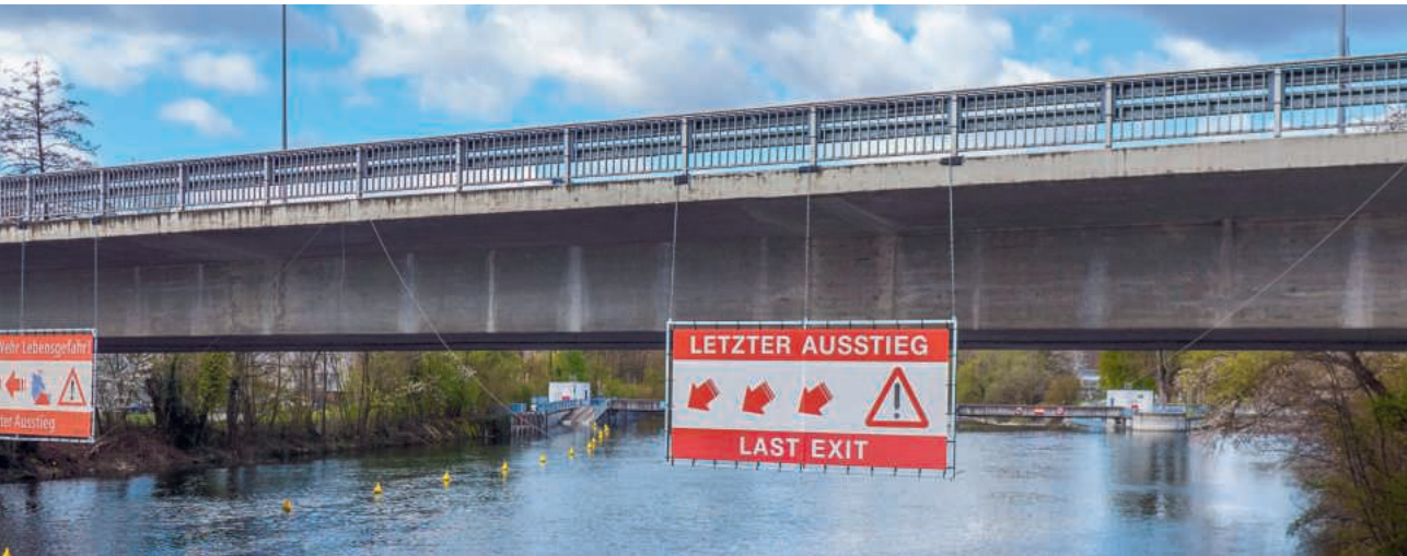
Brücke über die Limmat in Zürich-Höngg

G ibt es wirklich keinen Ausweg – oder traust du dich nur nicht, ihn zu gehen?