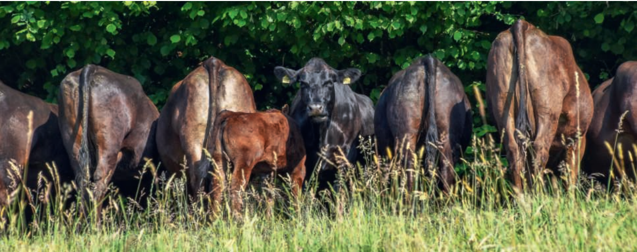
Kühe am Waldrand oberhalb des Rotsees

E s kommt darauf an, sich von den anderen zu unterscheiden. Ein Engel im Himmel fällt niemandem auf.