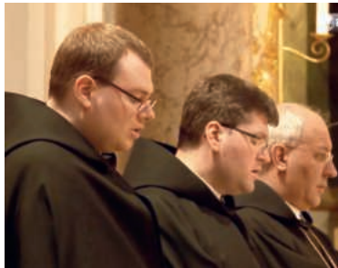
Bei den Benediktinern konnten bislang nur Priester die Leitung übernehmen.

Künftig können auch männliche Laien an die Spitze eines Klerikerordens gelangen. Das hat der Vatikan im Mai entschieden. Die neue Möglichkeit betrifft Orden, deren Gründer bestimmt hat, dass die Gemeinschaft von einem Priester geleitet wird, beispielsweise die Benediktiner, Dominikaner oder Jesuiten. Die Regelung soll jedoch die Ausnahme bleiben und bedarf der Zustimmung der vatikanischen Ordensbehörde in Rom.