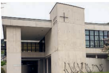
Die Kirchen der drei Krienser Pfarreien (von oben): St. Gallus, Bruder Klaus und St. Franziskus.