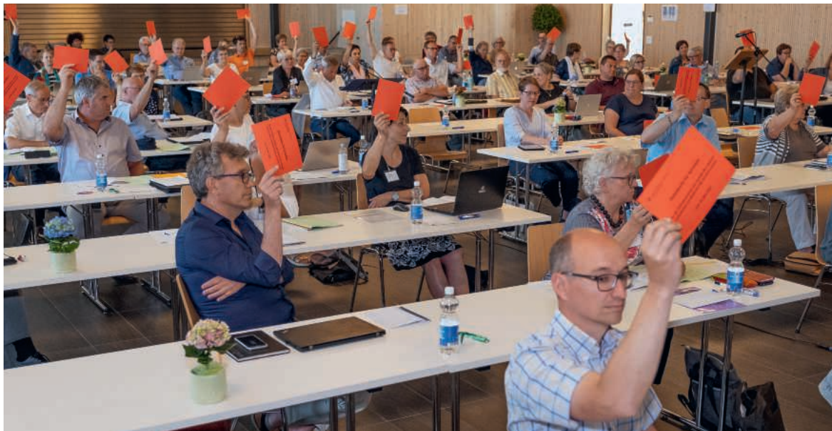
Ja zu einer grosszügigeren Gewinnverteilung: Die Synode im Centro der Italienerseelsorge in Emmenbrücke.