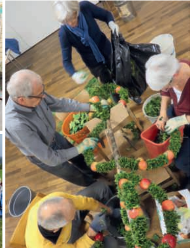
Palmen binden, «Öpfuchüechli» am Weihnachtsmarkt verkaufen, miteinander etwas erleben: aus dem Alltag der Kolpingfamilie Hochdorf.