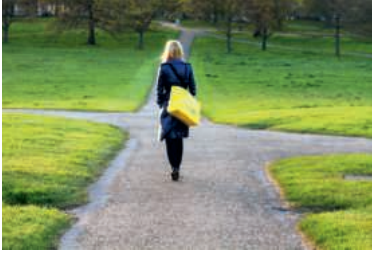
«Stehen Sie an einer Weggabelung im Leben?», fragt der Frauenbund.