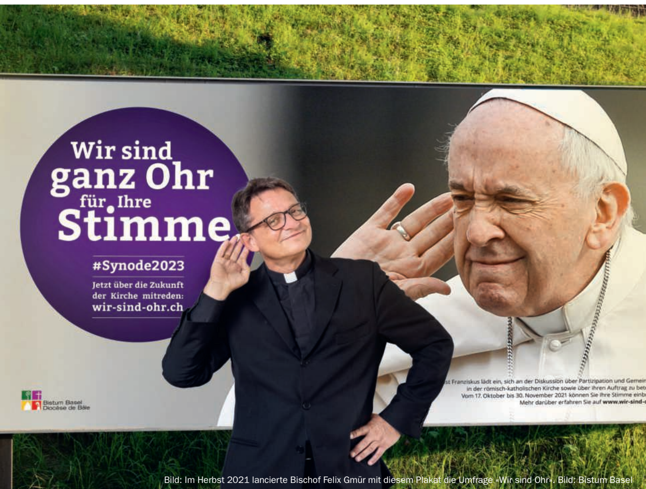
Bild: Im Herbst 2021 lancierte Bischof Felix Gmür mit diesem Plakat die Umfrage «Wir sind Ohr».

18/2022 16. bis 31. Oktober Katholische Pfarrei Reiden-Wikon