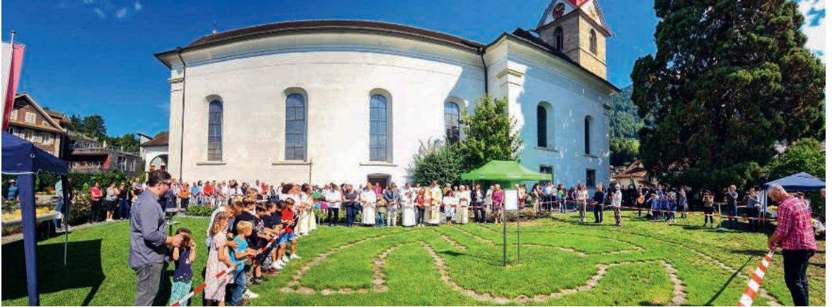
Bei der Eröffnung des Ge(h)dankenwegs: Die Station «Vergebung» steht vor der Pfarrkirche.