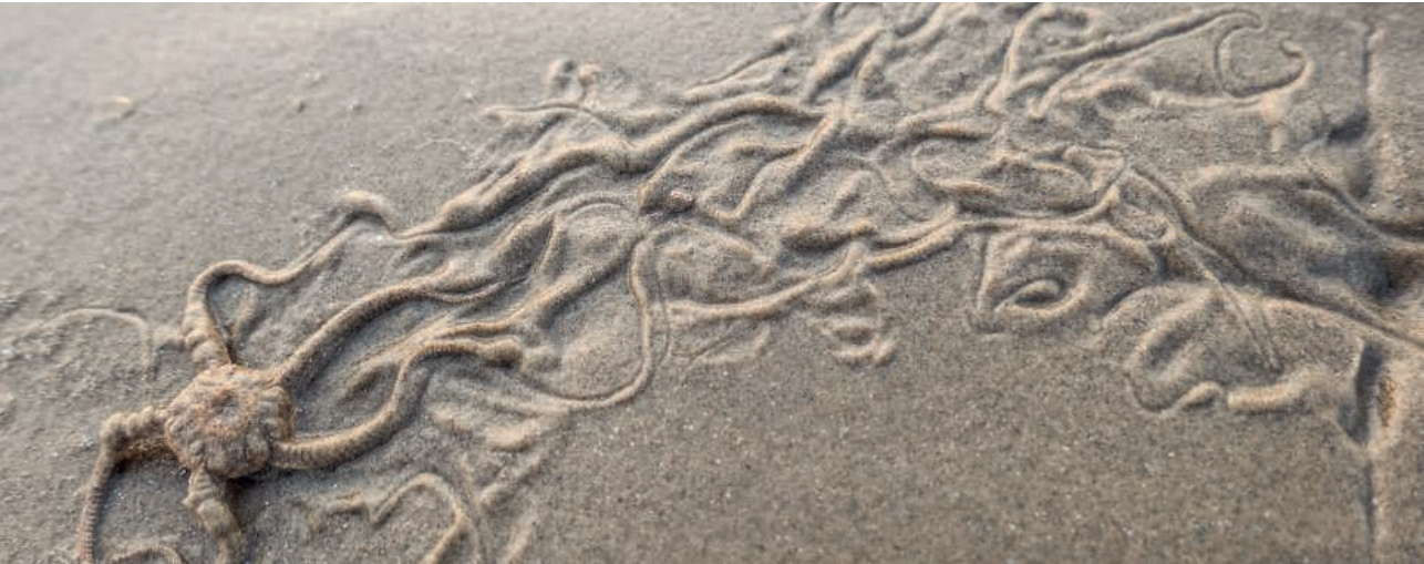
Schlangenstern an der Nordseeküste in Jütland, Dänemark

..... W er immer nur spurt, hinterlässt so gut wie nie Spuren.