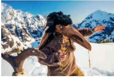
Schamane der Seabird Island First Nation (Kanada) mit Ritualmaske bei einer Raben-Zeremonie.