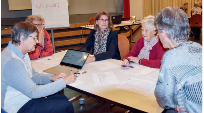
Im Herbst 21 diskutierten Gläubige in Fünfergruppen die «Wir sind Ohr»-Umfrage. Daraus resultieren im Bistum Basel nun zehn Leitsätze.

Trauerfeier: Sa, 29.10., 15.00 Lukaskirche Luzern