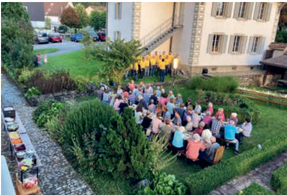
Bei bestem Wetter konnte der Freiwilligenanlass im Pfarrgarten durchgeführt werden.

Die Pfarrei Pfaffnu lebt dank der Mithilfe von vielen Freiwilligen, die sich auf verschiedenste Weise engagieren. Sie alle wurden vom Kirchenrat als Dankeschön am 6. September zu einem gemütlichen Abend in den Pfarrgarten eingeladen. Etwas mehr als die Hälfte der fast 100 Eingeladenen konnte an diesem Anlass teilnehmen.