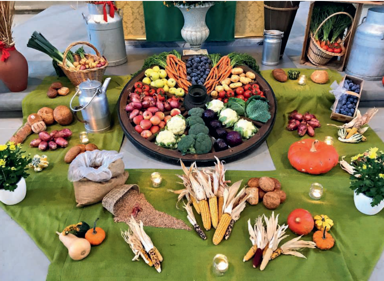
Dekoration am Erntedankfest 2023 in der Klosterkirche St. Urban.

10/2024 1. bis 31. Oktober Pastoralraum Pfaffnerental-Rottal-Wiggertal Pfaffnau-Roggliwil • St. Urban