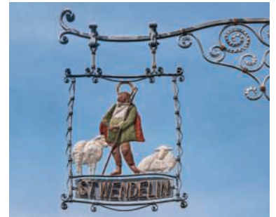
Wirtshauschild des ehemaligen Restaurants St. Wendelin in Lieli.