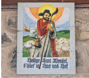
Schild an einem Stall beim Schloss Heidegg.