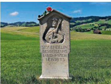
Bildstock an einem Feldrand in Schüpfheim.

Tatsächlich hat die Verehrung Wendelins in der Volksfrömmigkeit mehr Fuss