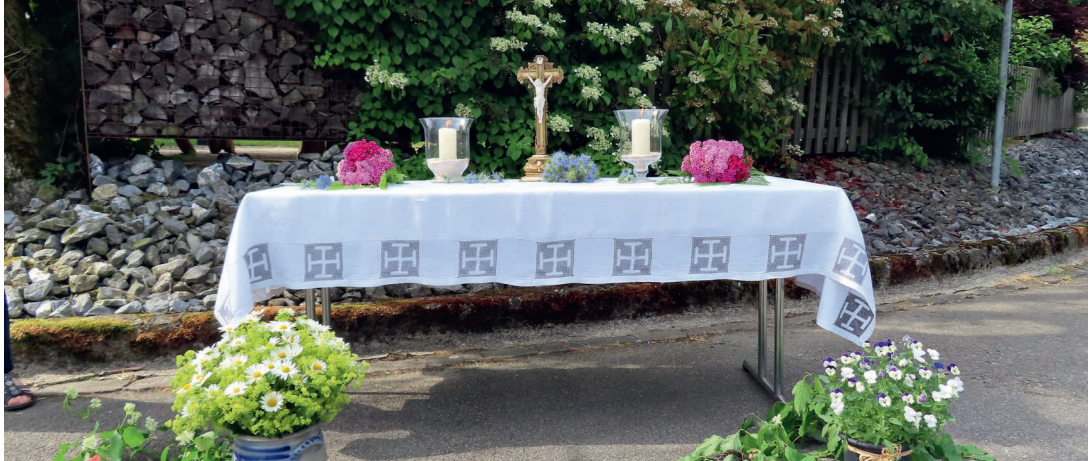
Geschmückter Altar in Pfaffnau.