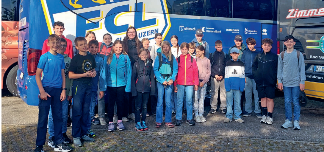
Das obligatorische Gruppenbild vor dem Europa-Park in Rust.