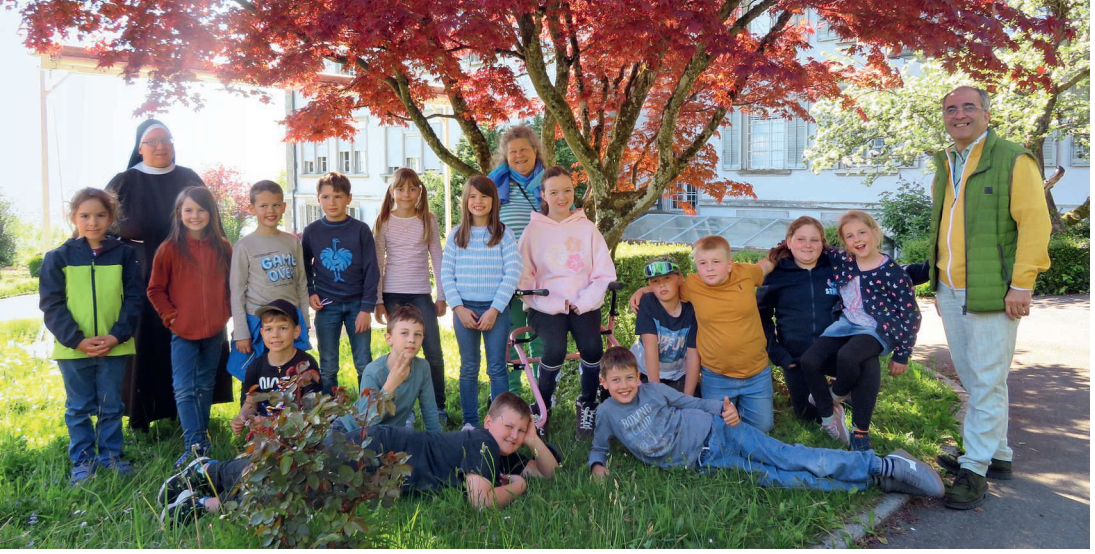
Reise der Erstkommunikanten